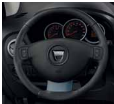
Regulator i ograničivač brzine