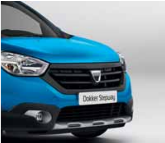
Nova prednja maska