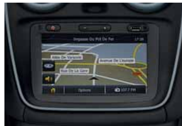
Multimedijalni sistem MEDIA NAV