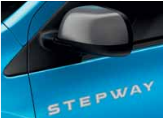
Obloga retrovizora Dark Metal i nalepnica Stepway