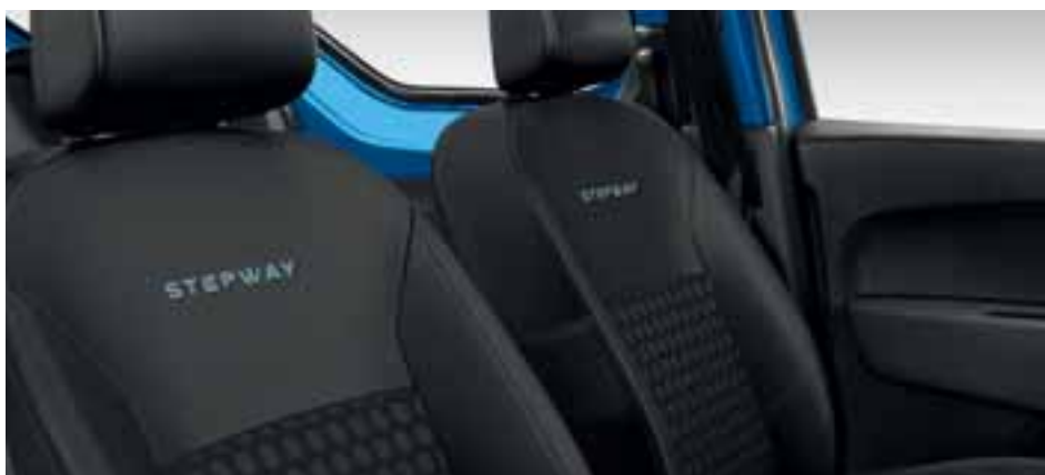
Posebne presvlake Stepway