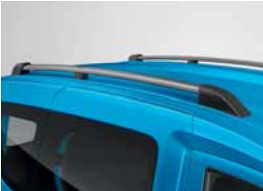
Krovni nosači Dark Metal